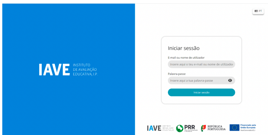
Figura 1 – Acesso à Plataforma de Realização de Provas do IAVE

( Obs.: Para as escolas que optaram pelo offline em rede ou standalone, os procedimentos para acederem à Plataforma de Realização de Provas do EduQA são os constantes no Manual Offline, publicado na Área Escolas do JNE);